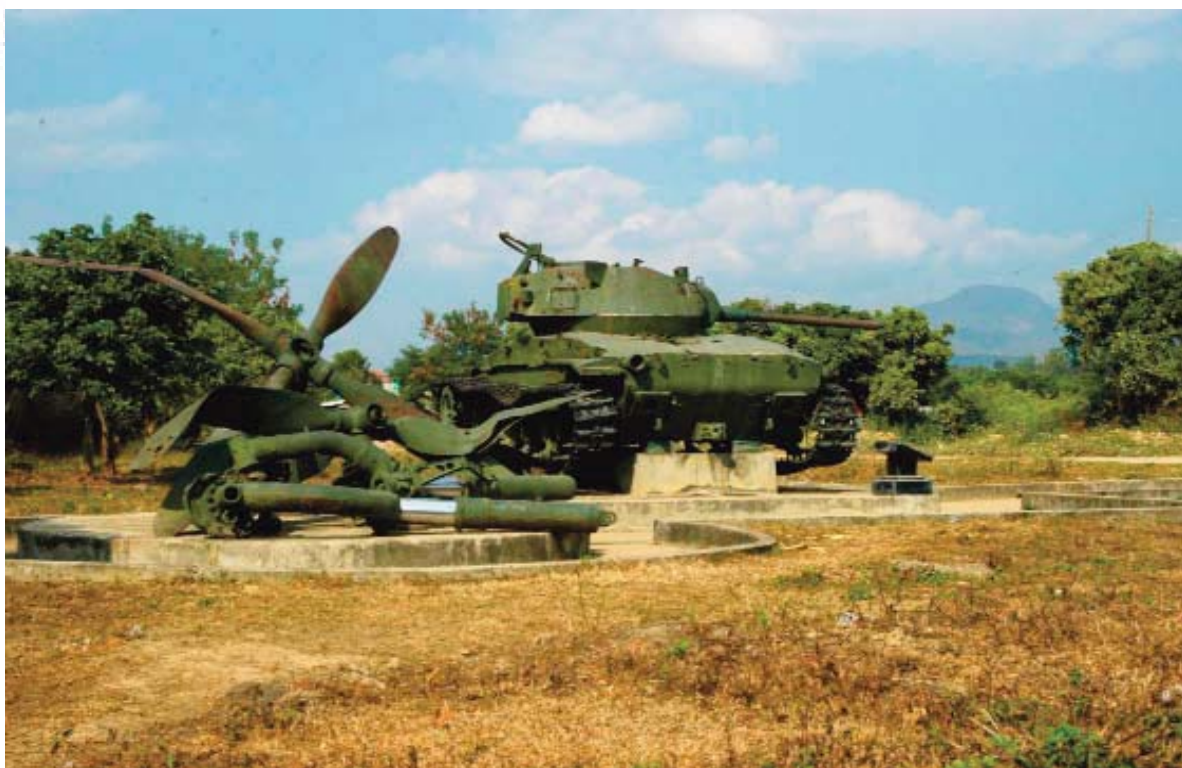
Hiện vật tại trận địa lòng chảo Điện Biên