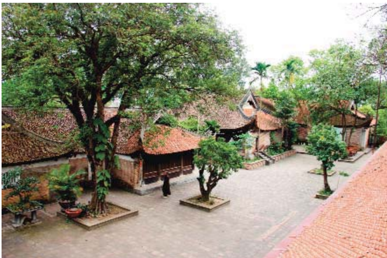
Một thoáng chùa Vĩnh Nghiêm

có dâng lên vua Hải nhạc danh sơn đồ và vịnh thơ tán: Phúc địa thứ tư tại Giao Châu là Yên Tử Sơn: