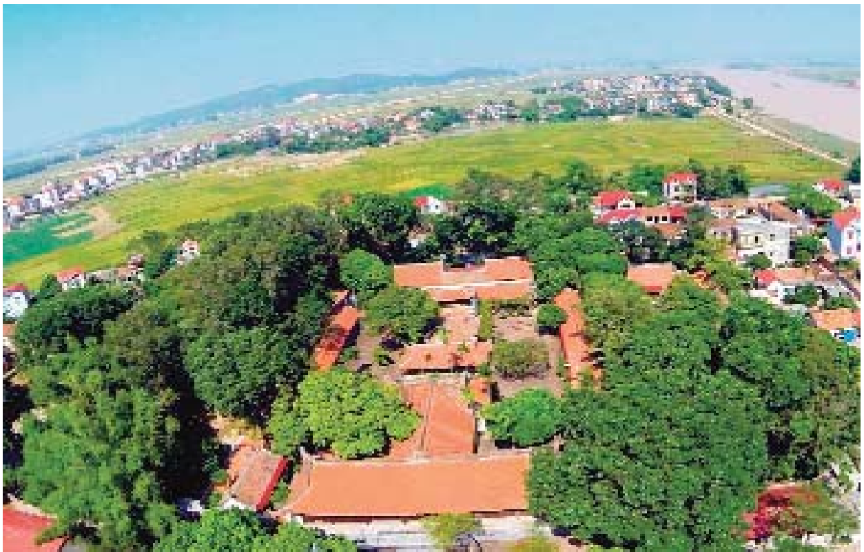
Toàn cảnh chùa Vĩnh Nghiêm