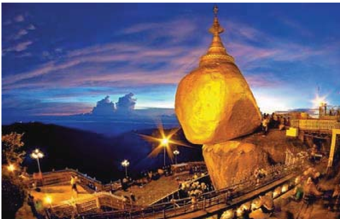
“Đá Vàng”

Nhiều người dân Myanmar tin rằng, ngôi chùa linh thiêng của họ được xây dựng trong thời gian đức Phật còn sống, tức là hơn 2400 năm cách ngày nay. Tuy nhiên, theo một số nghiên cứu, công trình kiến trúc Phật giáo này được xây dựng thời vua Tissa (trị vì ở Myanmar thế kỷ XI) 1 . Do đó, lịch sử ra đời của chùa Kyaikhtiyo thực sự vẫn còn là một ẩn số đối với các nhà nghiên cứu về lịch sử - văn hoá Myanmar truyền thống.