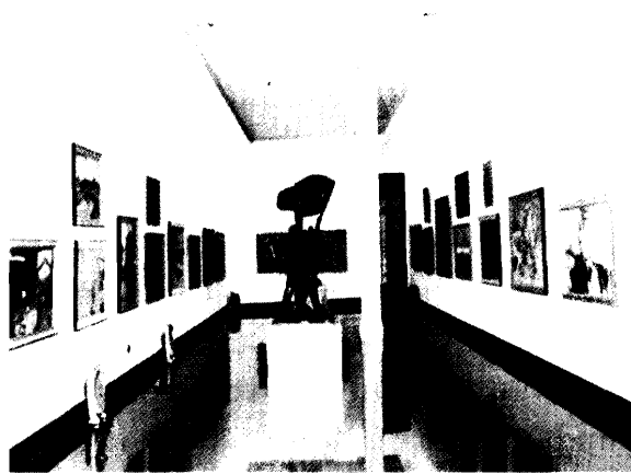
Phòng trưng bày các tác phẩm màu dầu Bảo tàng Mỹ thuật Việt Nam

Chiếu sáng chung mang tính điều hoà, là làm sáng đồng đều lên bề mặt các tác phẩm treo trên diện tường, bằng cách dùng đèn ánh sáng trắng ấm được lắp đặt ở những vị trí bảo đảm che kín đèn, ánh sáng không trực tiếp dội vào tranh và thị giác người xem. Chiếu sáng cục bộ là làm cho nguồn sáng tập trung dội vào các tác phẩm điêu khắc bày trên diện sàn, vào các hiện vật nhỏ trong tủ bằng cách dùng đèn dây tóc Vonfram, đèn Halogen màu sáng ấm; đồng thời còn tính tới khoảng cách chiếu sáng để không gây ra hư hại đối với tác phẩm- hiện vật do tác động của nhiệt độ từ đèn toả ra. Chỉ số chiếu sáng trong các phòng trưng bày được xác định tương ứng với các thể loại thuộc chất liệu không nhạy cảm ánh sáng như tượng bằng kim loại, đồ gốm, đồ đá... với các thể loại thuộc chất liệu