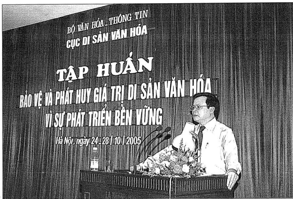
Bộ trưởng Bộ Văn hóa - Thông tin Phạm Quang Nghị phát biểu tại lớp Tập huấn năm 2005

(Phát biểu của Bộ trưởng Bộ Văn hóa - Thông tin Phạm Quang Nghị tại Lớp Tập huấn toàn quốc ngành di sản văn hóa năm 2005, tổ chức tại Hà Nội, từ 24 - 28/10/2005)