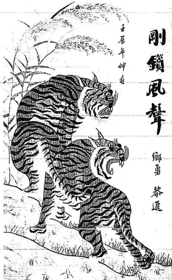
Một số hiện vật trong triển lãm

liệu điển dã gần đây, cho phép chúng tôi suy nghĩ đến một quần thể Phật giáo quanh Chương Sơn, Đọi Sơn, đã khiến cho vùng Hà Nam - Nam Định như là một vùng đất của Phật giáo Lý. Những con khỉ có liên quan gì tới những câu chuyện của giáo lý nhà Phật sẽ được giới nghiên cứu luận bàn tiếp, khi tư liệu có quan hệ tới những pho tượng này không cho phép nói gì hơn.