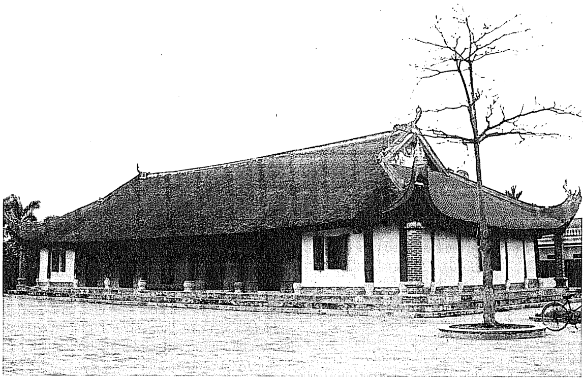
Đình Xuân Dục, thế kỷ XVII

định thầu cho các dự án tu bổ, tôn tạo di tích cần được áp dụng rộng rãi (trừ các hạng mục hạ tầng cơ sở kỹ thuật)