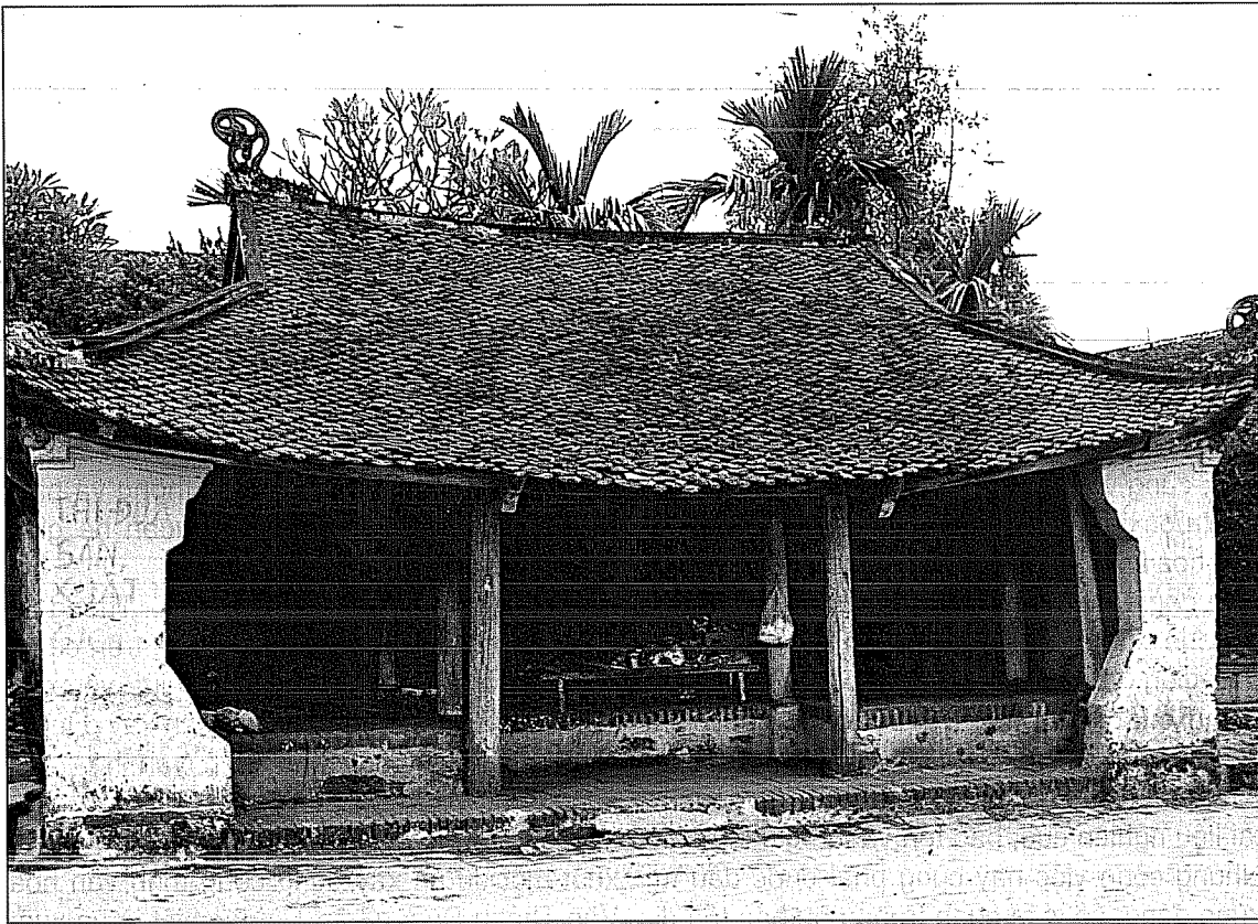
Điểm tiếp khách của đình Mông Phụ

cổ ở Đường Lâm vô cùng quan ngại trước thực tế này.