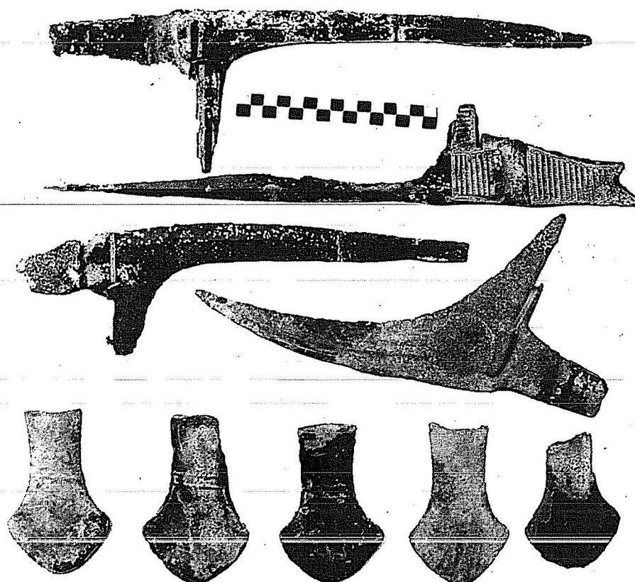
Qua và rìu đồng (phát hiện năm 2005) - Ảnh: Ban quản lý Di tích Đồng Nai