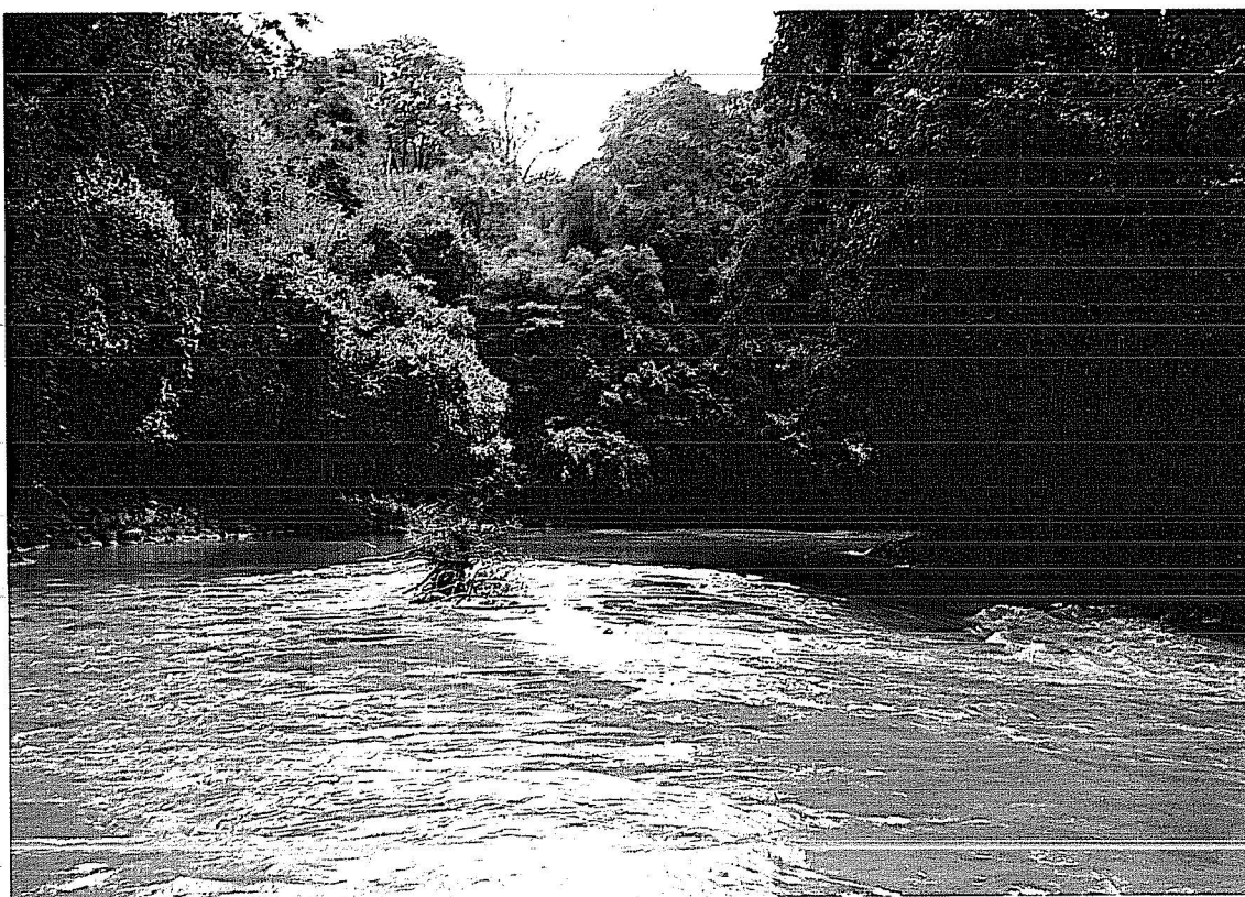
Sông Đồng Nai (đoạn qua Cát Tiên)

Hòe), còn đó rạch Bà Nghĩa, rạch Thiêng Liêng, rồi sông Lòng Tàu, Nhà Bè, bao nhiêu chiến hạm, tàu vận tải của Pháp, Mỹ đã đành phận chôn vùi để làm môi, làm ổ cho cá tôm rừng Sác.