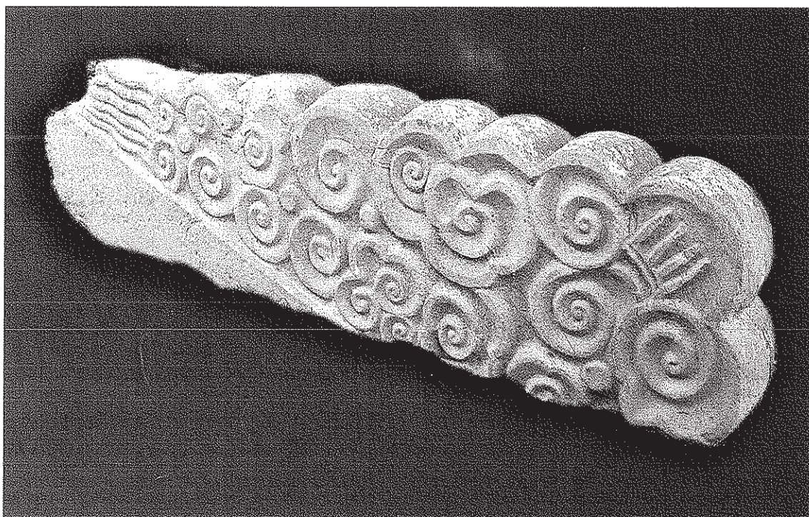
Văn hóa Long, Nhân Trai, Hải Phòng (đá, thế kỷ 10)

- Nguồn ngân sách thành phố: Từ 2001 đến 2006, nguồn ngân sách của Thành phố đầu tư cho các dự án bảo tồn, tôn tạo di tích lớn là 8,181 tỷ đồng. Đó là dự án quy hoạch tổng thể, tôn tạo, phục dựng cảnh quan những di tích liên