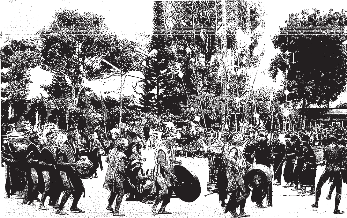
Hội diễn Cồng chiêng Tây Nguyên

hóa việc lập hồ sơ dự án, thiết kế, bảo tồn, tu bổ di tích, tổ chức thi công, định mức nhân công, vật liệu... Công trình đã đạt được giải cao nhất về bảo tồn di sản năm 2010 của Hiệp hội Kiến trúc sư quốc tế (UIA) khu vực Châu Á - Thái Bình Dương.