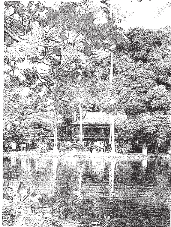
“Vườn cây, ao cá, nhà nếp nhà thân thương” - Khu Di tích Hồ Chí Minh tại Phủ Chủ tịch