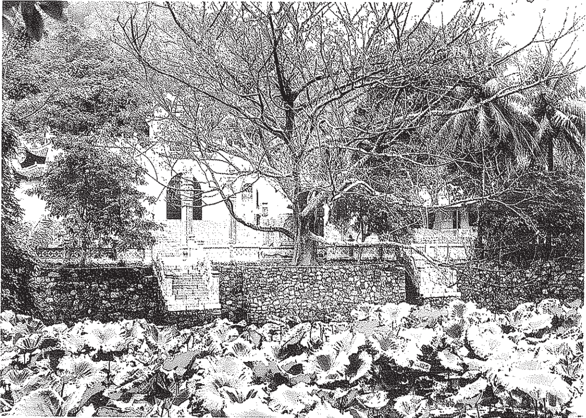
Đền Bà Triệu, Hậu Lộc, Thanh Hóa

nổi danh đất nước. Đây là những nhân vật mà sử sách lưu danh mình chúng rõ nét cho truyền thống văn hóa, tinh hoa và khí phách, cốt cách của xứ Thanh.