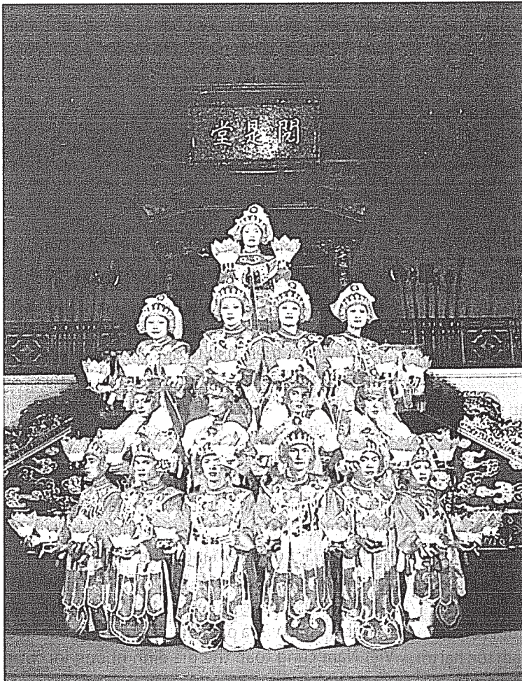
Múa Hoa Lân, Nhã nhạc cung đình Huế

"Luật di sản văn hóa" và "Luật sửa đổi, bổ sung một số điều của Luật di sản văn hóa" thường xuyên được tuyên truyền, phổ biến trên các kênh thông tin khác nhau. Hệ thống pháp luật về bảo vệ di sản văn hóa tiếp tục được hoàn thiện. Trong một năm qua, 03 Thông tư của Bộ Văn hóa, Thể thao và Du lịch đã được ban hành. Ngoài ra, một số dự thảo văn bản quy phạm pháp luật cũng đang được khẩn trương hoàn thiện, song song với việc kịp thời công bố các thủ tục hành chính mới ban hành hướng tới mục tiêu đơn giản hóa, giảm thiểu tối đa những vướng mắc, góp phần đưa pháp luật thực sự đi vào cuộc sống.