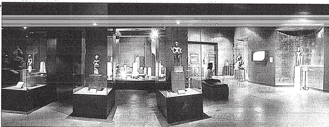
Phòng trưng bày B

tiếp và gián tiếp của tôn giáo Khmer đến nền văn minh Khmer cổ đại. Bao gồm cả ở các tác phẩm văn học, nghệ thuật, điêu khắc, kiến trúc và cuộc sống hàng ngày. Khách tham quan có cơ hội khám phá những truyền thuyết thú vị, những câu chuyện dân gian độc đáo đã thúc đẩy sự phát triển của nền văn minh Angkor trong nhiều thế kỷ qua.