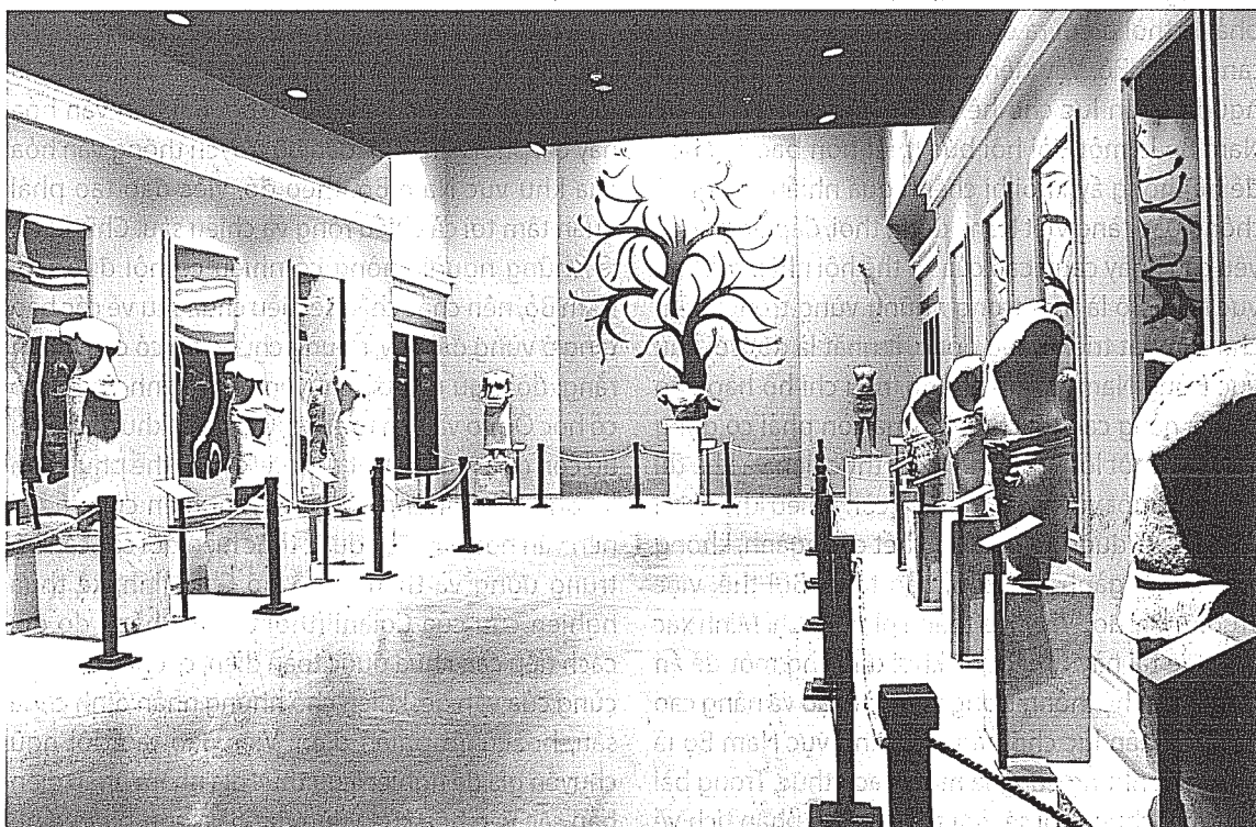
Phòng trưng bày G