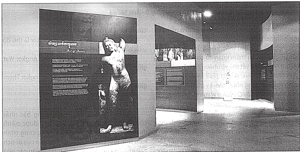
Phòng trưng bày A