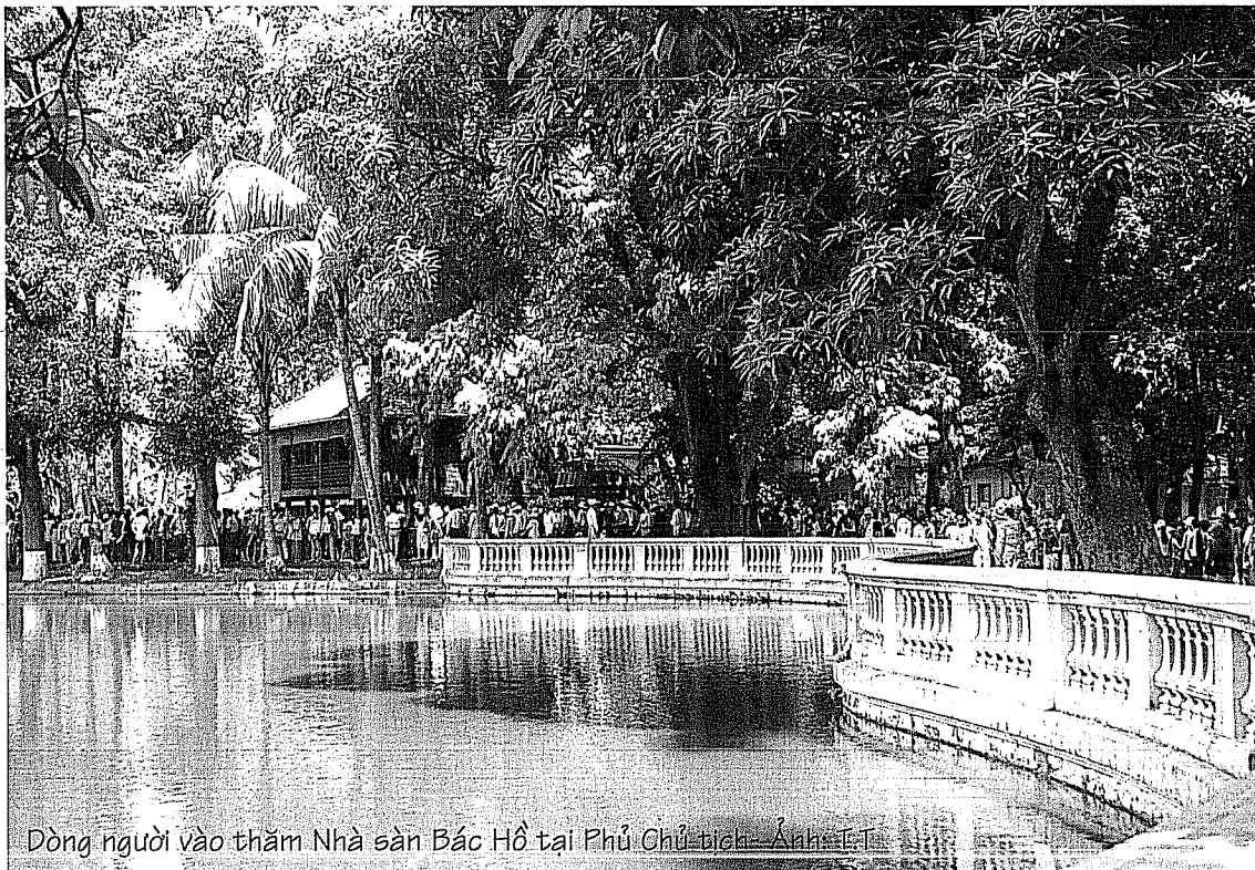
Dòng người vào thăm Nhà sàn Bác Hồ tại Phủ Chủ tịch

vi bảo vệ, bảo quản và phát huy tác dụng (khu A Khu di tích quản lý, khu B và C là nơi hai cơ quan Văn phòng Chính phủ và Văn phòng Chủ tịch nước đang sử dụng). Tiếp sau, để phù hợp với cơ chế tổ chức và hoạt động chung của ngành Bảo tồn Bảo tàng, ngày 25-10-1990, Bộ trưởng Bộ Văn hóa-Thông tin-Thể thao và Du lịch đã ký Quyết định số 952/TC-QĐ, điều 3 có ghi: "Khu di tích lịch sử của Chủ tịch Hồ Chí Minh tại Phủ Chủ tịch, gọi tắt là Khu di tích Phủ Chủ tịch, hoạt động như bảo tàng loại II". Qua hai năm hoạt động, ngày 6-11-1992, Bộ trưởng Bộ Văn hóa-Thông tin ký Quyết định số 1575/TC-QĐ chuyển Khu di tích Chủ tịch Hồ Chí Minh tại Phủ Chủ tịch trực thuộc Bộ Văn hóa-Thông tin. Kể từ đó trở đi, Khu di tích Chủ tịch Hồ Chí Minh tại Phủ Chủ tịch không ngừng hoạt động nghiên cứu về văn hoá, sự nghiệp, tư tưởng của Chủ tịch Hồ Chí Minh, tuyên truyền rộng khắp trong và ngoài nước. Với những thành tích đạt được, Đảng và Nhà nước ta đã trao tặng cho tập thể cơ quan những danh hiệu cao quý: Huân chương Độc lập hạng Ba, Huân chương Lao động hạng Nhất, Cờ thưởng của Chính phủ, cùng rất nhiều bằng khen của Bộ Văn hoá - Thông tin. Như vậy, ngoài tính pháp quy do Đảng và Nhà nước công nhận, hệ