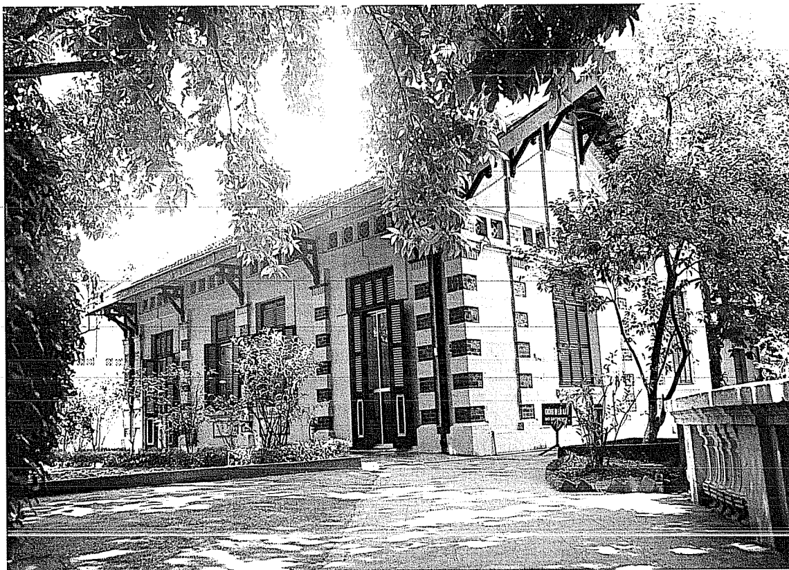
“Nhà 54”, nơi Bác Hồ đã ở và làm việc từ 1954 đến 1958, Khu di tích Chủ tịch Hồ Chí Minh tại Phủ Chủ tịch

tháng, quý, 6 tháng và hàng năm. Ví dụ: Việc bảo quản phía ngoài và trần, mái các ngôi nhà mỗi tháng một lần, vào các buổi chiều thứ hai, thứ sáu hàng tuần nghỉ đón khách tham quan. Đối với việc chăm sóc vườn cây, ao cá (cắt cỏ, tỉa cành tạo tán, xới xáo, phòng trừ bệnh tật cho cây, cho cá) cũng mỗi tháng một lần. Việc bón phân cho cây và xử lý môi trường nước ao cá mỗi quý một lần, tùy theo mùa vụ. Hàng năm, cứ vào các dịp ngày lễ, ngày tết, lãnh đạo Khu di tích thường giao cho công đoàn tổ chức lao động toàn cơ quan để cọ rửa, vệ sinh toàn bộ sân, hè, đường trong khu vực cơ quan, vừa làm công tác bảo quản, vừa phục vụ an toàn, vệ sinh cho khách tham quan.