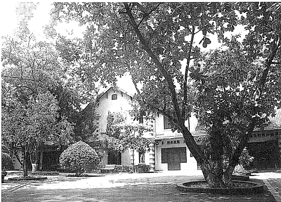
Một phần khuôn viên Khu di tích Chủ tịch Hồ Chí Minh tại Phủ Chủ tịch

H ột trong những nhiệm vụ chủ yếu của công tác bảo tồn Khu di tích Chủ tịch Hồ Chí Minh tại Phủ Chủ tịch là bảo quản, giữ gìn tài liệu, hiện vật và môi trường cảnh quan di tích, bởi tất cả môi trường cảnh quan và hiện vật ở đây đã gắn liền với cuộc đời và sự nghiệp của Chủ tịch Hồ Chí Minh tại Phủ